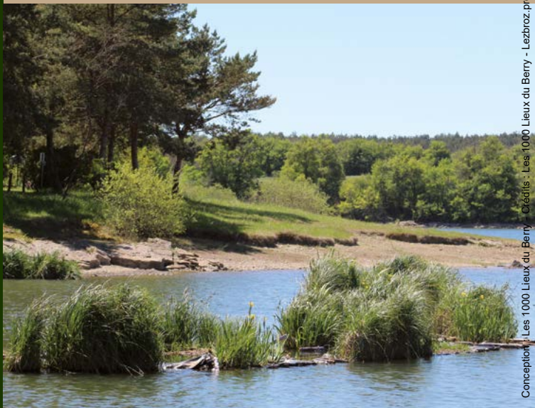
Conception : Les 1000 Lieux du Berry

Accueil de groupes sur réservation, contactez-nous pour organiser votre visite !