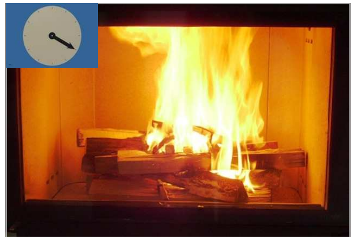
Propagation de la combustion à l'ensemble du bois