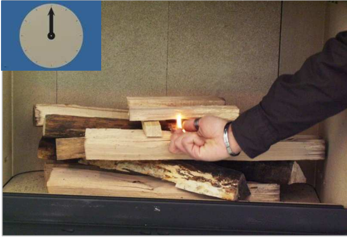
Allumage de l'allume-feu