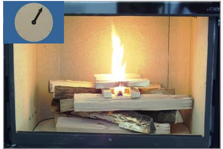
Inflammation du module d'allumage