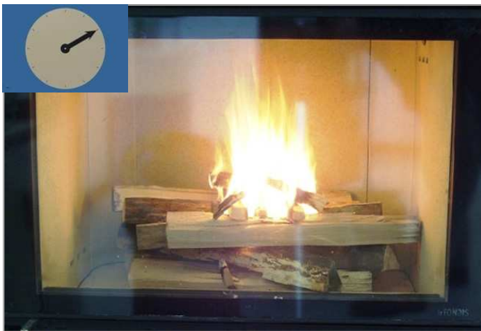
Combustion vive du module d'allumage