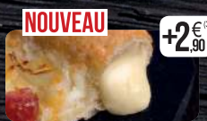
PÂTE MOZZA CRUST OIGNON

Le juste équilibre entre finesse et goût.