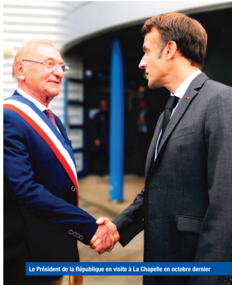
Le Président de la République en visite à La Chapelle en octobre dernier

L'impôt sur l'activité économique produit une ressource fiscale annuelle de l'ordre de 2 millions d'euros. La commune n'en reçoit que 855 000 €. Le service, par l'Etat, d'une dotation de Bourg-Centre de 144 000 € annuelle vient de lui être supprimée, au motif de son appartenance à l'agglomération. L'impôt produit par le parc photovoltaïque est perçu par le département et l'agglomération. Rien pour la commune !