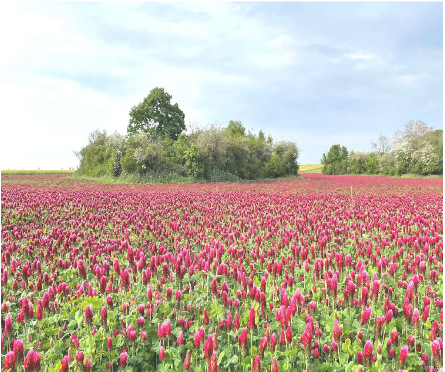
Champ de trèfles "incarnat" rouges en face des écoles à Trouy nord