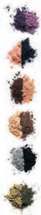
Ocean Ref. 396