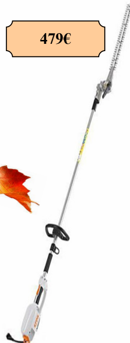
HL 71 230 V 600 W 5.9 KG Longueur 254 cm