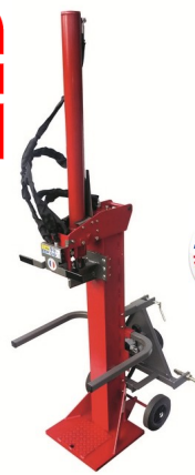
FENDEUSE MORGNEUX FB 13 THE 110 13 T