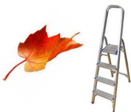
Escabeau 4 marches Hauteur totale 1,47m 106,00€ ttc