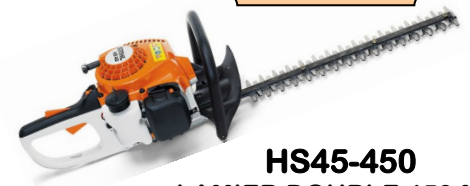
HS45-450 LAMIER DOUBLE 450 MM CYLINDREE : 27.2 CC POIDS : 4.7 KG