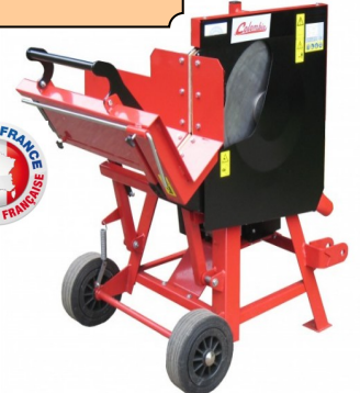
SBP600PF 3 POINT SUR PRISE DE FORCE ARRIERE MICROTRACTEUR LAME 600 MM CHROME CAPACITE DE SCIAGE 205 MM