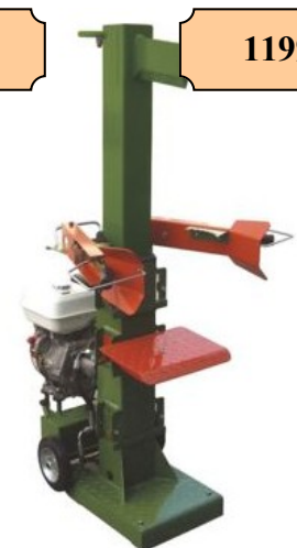
FENDEUSE 10 TONNES VERTICALE MOTEUR THERMIQUE CAPACITE BUCHE 135X40 CM