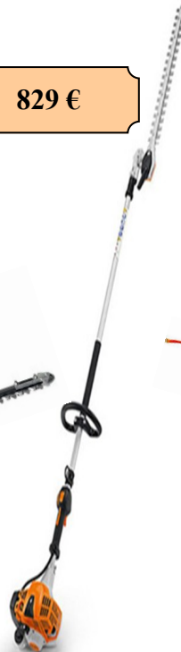
HL 94 C-E 24.1 cm 3 0.9 kw 6kg100 Longueur : 242 cm