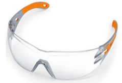
LUNETTE DE PROTECTION LIGHT PLUS