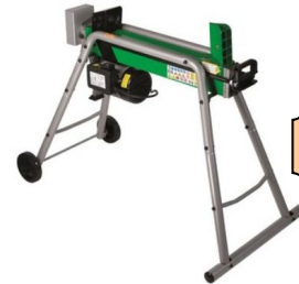
FENDEUSE 6 TONNES HORIZONTALE 230 V 2100 W CAPACITE BUCHE 52X25 CM