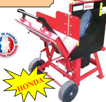
PBP600H MOTEUR HONDA GP160 LAME 600 MM CHROME CAPACITE DE SCIAGE 205 MM