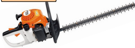
HS 45-600 LAMIER DOUBLE CYLINDREE : 27.2 CC POIDS : 5.0 KG