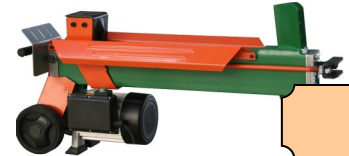
FENDEUSE 5 TONNES HORIZONTALE 230 V 1500 W CAPACITE BUCHE 52X25 CM