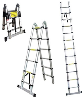
Échelle télescopique transformable Pliante et légère Fabrication aluminium & plastique 378,00€ ttc