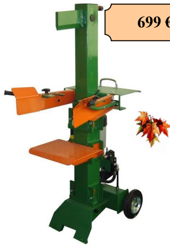
FENDEUSE 8 TONNES VERTICALE 230 V 3000 W CAPACITE BUCHE 106X40 CM