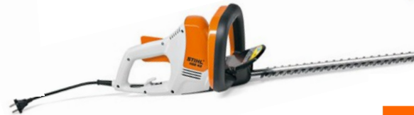
HSE 42 LAMIER DOUBLE 450 MM 220 VOLTS POIDS : 3 KG