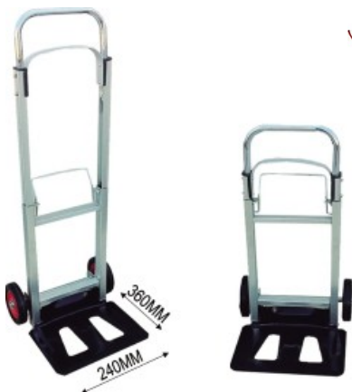
Diable compacte aluminium 86,00€