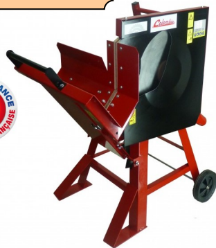
PBE600 220 V 2200 W LAME 600 MM CHROME CAPACITE DE SCIAGE 205 MM