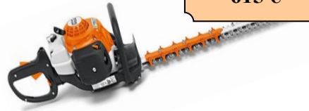
HS82R600 LAMIER DOUBLE TRANCHANT CYLINDREE : 22.7 CC POIDS : 5.4 KG