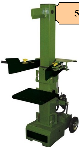
FENDEUSE 7 TONNES VERTICALE 230 V 3000 W CAPACITE BUCHE 104X40 CM