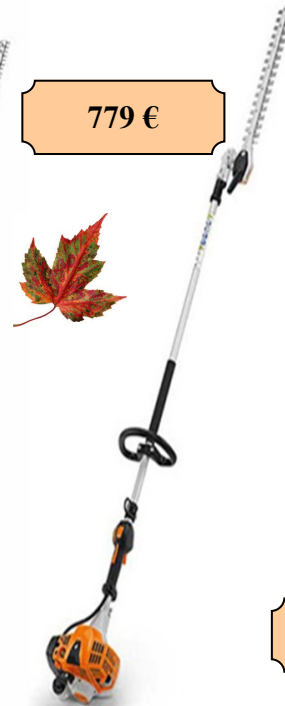
HL 92 C-E 21.4 cm 3 0.9 KW 6kg100 Longueur 232 cm