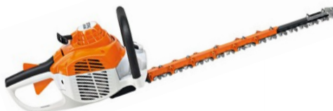
HS 56-C-E LAMIER DOUBLE TRANCHANT CYLINDREE : 21.4 CC POIDS : 4.5 KG