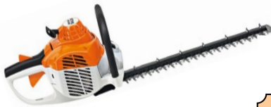
HS 46 C-E LAMIER DOUBLE 550 MM CYLINDREE : 21.4 CC POIDS : 4.3 KG