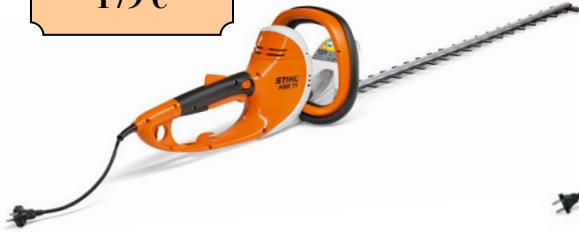
HSE 71-600 LAMIER DOUBLE 600 MM 220 VOLTS POIDS : 4.1 KG