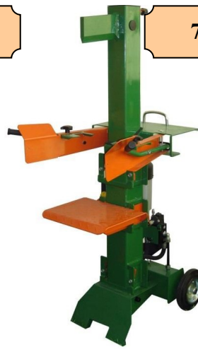
FENDEUSE 10 TONNES VERTICALE 230 V 3000 W CAPACITE BUCHE 106X40 CM