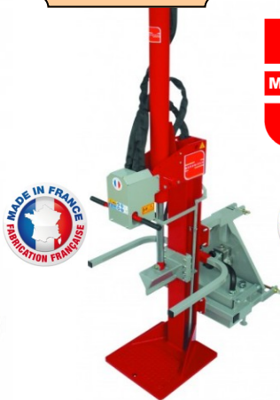
FENDEUSE MORGNEUX FB16TH 3 POINTS 16 TONNES *Cardan en option