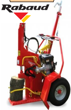
FENDEUSE DE BÛCHES THERMIQUE F13 13 T DE POUSSÉE 220 V