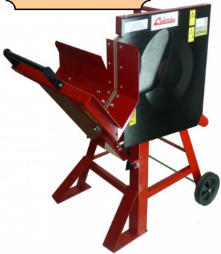
PBE500 220 V 1840 W LAME 500 MM CHROME CAPACITE DE SCIAGE 170 MM