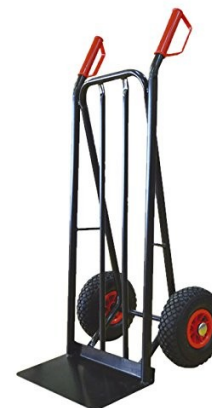
Diable acier 85,00€